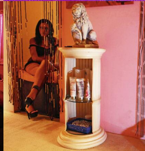
Sex-Arbeitsplätze in Deutschland: Reiseveranstalter bieten bis zu achttägige Touren in deutsche Bordelle an, versprochen werden bis zu