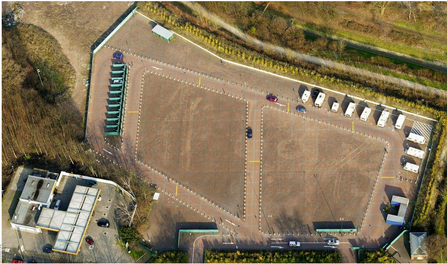
Straßenstrich in Essen mit „Vertrichtungsboxen“ (I.): „Wer hier arbeitet, hat ein krasses Problem“

sind. Ein Bordellbetreiber ist frei von derartigen Zwängen: Er muss den Behörden nur melden, wann der Laden eröffnet wird.