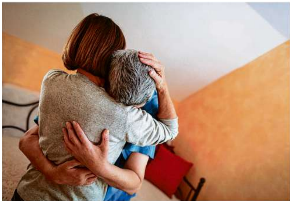
Längst ein etablierter Weg: Sexualassistenz für Menschen mit geistigen oder körperlichen Einschränkungen. Speziell ausgebildete Prostituierte helfen Menschen mit Behinderung, Küsse, Zärtlichkeit und Sex zu erfahren.